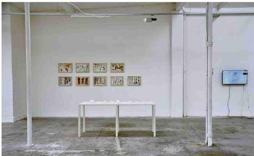
Objektives und Subjektives. Ausstellung im Projektraum M54.

HeK , Freilager-Platz 9. Münchenstein. Mi–So 12–18 Uhr. Bis 30. Dezember. www.hek.ch